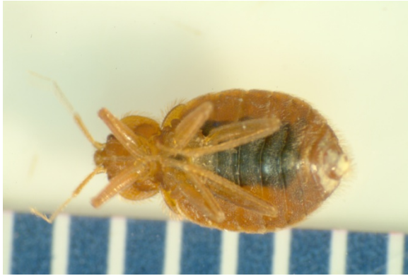
臭虫成虫长 5 毫米 (1/4 英寸)