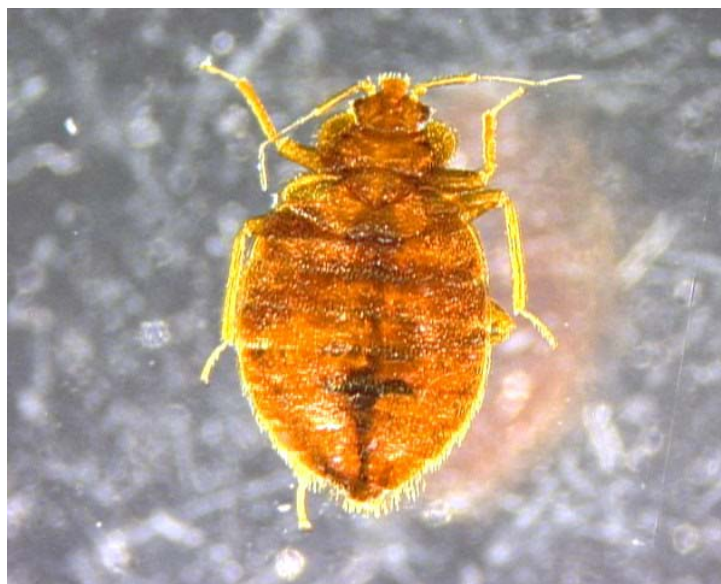
Timothy O'Connor 摄