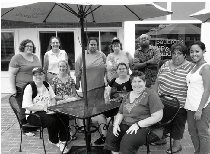
Miembros del Programa Piloto de la Alimentación Sana de la región sur del DDS

El Departamento de Servicios de Desarrollo (DDS) lanzó un programa piloto de un grupo social de apoyos enfocado en el ejercicio y la alimentación sana, el cual ha estado tendiendo gran éxito. Utilizando el Nike Fuelband, el programa piloto alienta a los participantes a hacer ejercicio y rastrear su desempeño mientras también enseña destrezas sobre la selección y consumo de alimentos sanos. Con un grupo inicial de 8 participantes y 4 miembros del personal, en los primeros seis meses el grupo perdió 100 libra conjuntamente e informó un aumento en su felicidad en la pos-prueba.