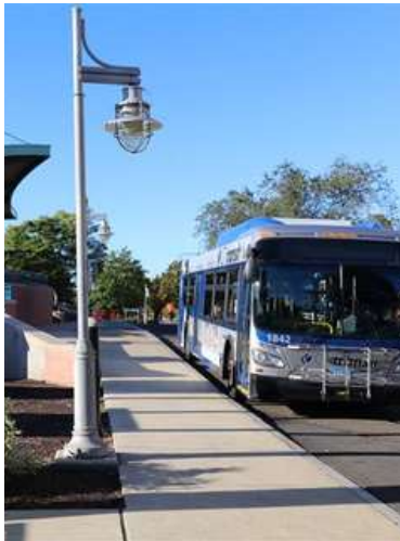
Estación de autobuses CT transit