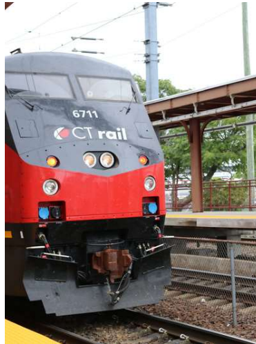
Estación de trenes CT rail