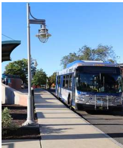
CT transit Bus Station