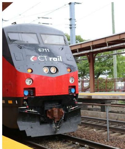
CT rail Train Station